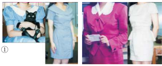
学生時代に趣味で作った洋服。①ストライプ柄のパフスリーブ・フレアスカートワンピース、②ショールカラーのダブル仕立てのワンピース、③サマーピンクのペブラムスーツ、④リネン製のベルト付きドッキングワンピース

はニュートラを着ていましたし、80年代は、ハマトラ、カラス族、オリィブ少女になり、バブル時代は、ボディコン(ワレン)のオヤジギャルでしたし、イタリアインポートの原色アイテムを身に着け、渋カジ(紺ブレハリィ)で浅野風になり、90年代初頭はフレカジ、90年代中頃は厚底靴を履いたアムラー風でした。これらの目まぐるしいファッションの変遷は、自分のスタイルを見つける旅でした。