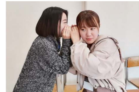
(上)参加者とTAで集合写真 (下)Message game をして楽しめました