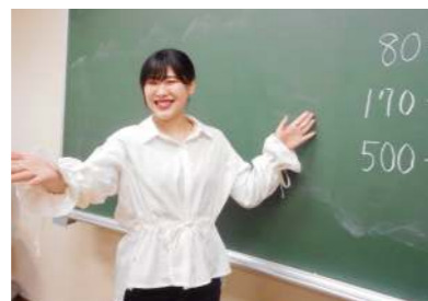
採用試験に向けて模擬授業の練習を行いました