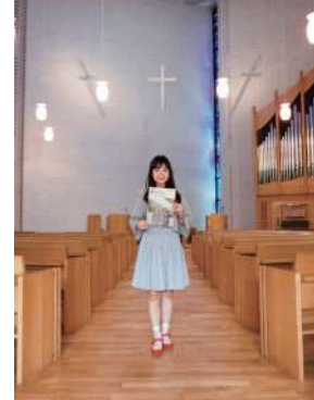
《キャンパスリポーター》