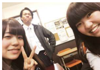
人生の節目の度に先生に会いに行き、近況報告とともにたくさんお話していました