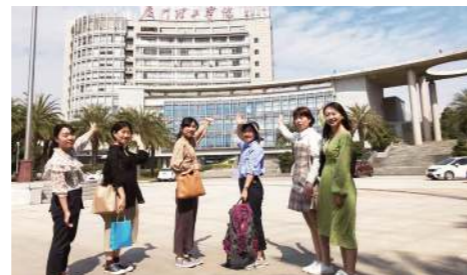
厦門理工学院にて