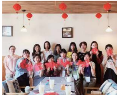
中国文化体験で切り絵を作成した時の様子