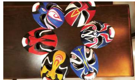
中国文化体験で京劇のマスクに絵を描きました

きました。これからはもっと日本語力を上達させ、いつでもどこでも自信を持って日本語が話せるよう頑張ります。