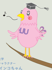
広島女学院大学 オリジナルキャラクター ジョウクインコちゃん