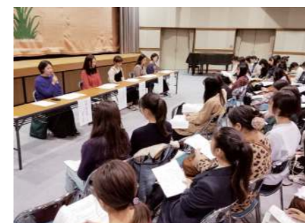
先輩たち全員の話を聞いているところ