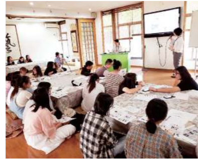
日本文化紹介の様子。「日本語のキャラクター言葉」を、実際のアニメや漫画を用いて説明

この実習を通し、教壇に立つには臨機応変さが求められること、学習者の様々な反応を予測して授業を作ることの難しさを学ぶことができました。