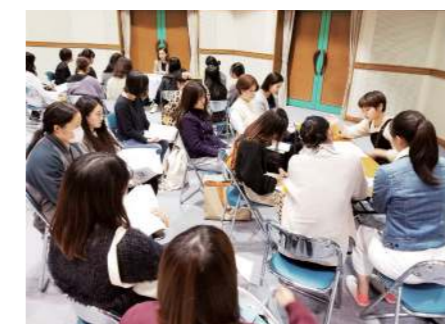
直接質問し、さらに詳しく話を聞く時間も