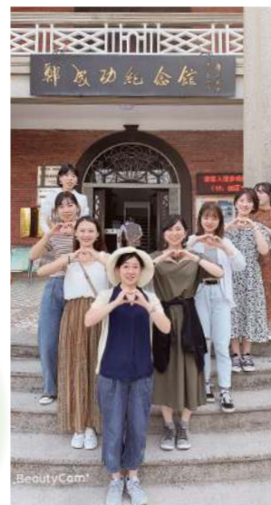
コロンス島内の鄭成功記念館の前で