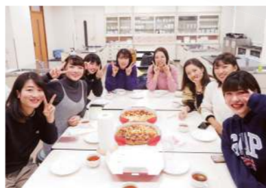
ゼミのクリスマスパーティにみんなでピザを食べました