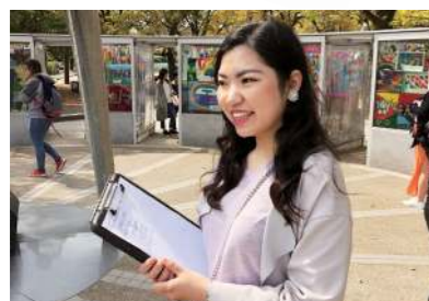
先生から教わった挑戦し続けることの大切さ。中学から始めた平和活動を今でも継続しています