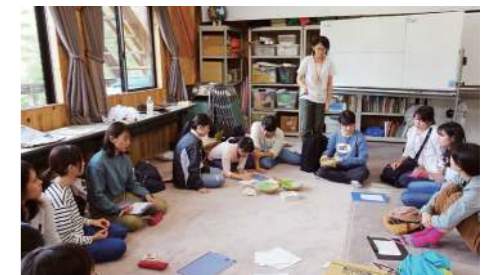
活動終了後の意見交換の様子

私 たちの キャンパス ライフ 様々な出来事を体験した 「キャンパスリポーター」たちが 等身大の想いとともにはポートします。