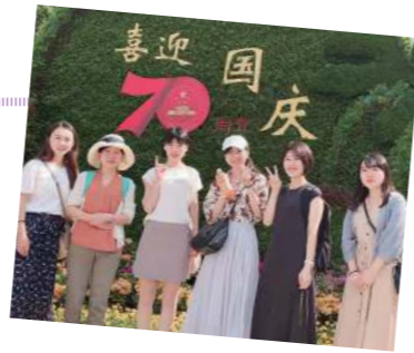
厦門にある植物園に行きました