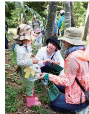
(上)ファッションショーをしました (下)自分のお気に入り紹介のワンシーン