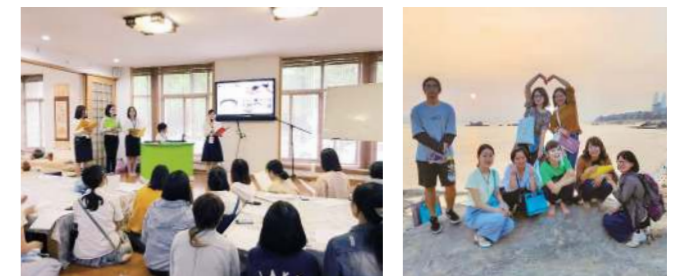
(右) 廈門の観光地にて (左) 日本文化紹介。日本食の配膳の仕方に関するクイズをしました

日本文化紹介は、「日本食について」「日本人の恋愛について」という2つのテーマで行いましたが、日本食の紹介では中国も箸を使うため、多くの共通点を感じました。 今回、私たちは日本の文化を伝える側でしたが、現地に滞在することで、より中国のことを知ることができました。理工学院の学生たちは、休みの日や空き時間も必ず一緒にいてくれて、廈門のいろいろな場所を案内してくれました。この手厚いおもてなしには、とても感動しました。 私は4月から社会人になります。日本語教育とは関係のない職業に就きますが、これからも何らかの形で、日本の魅力を伝える活動に関わっていきたいと思います。