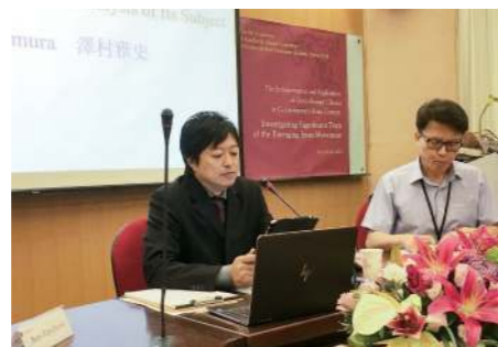
国際新約聖書学会アジア太平洋連絡委員会学術大会 (於 台湾・中原大学) で研究発表 (2018年)

スタンフォード大学といえは、アップル創業者スティーブ・ジョブズの「Stay Hungry, Stay Foolish」というフレーズで終わる卒業式のスピーチが有名です。その中でジョブズは、若い頃、これといったわけもなくカリグラフィーに熱中したことが後のMac