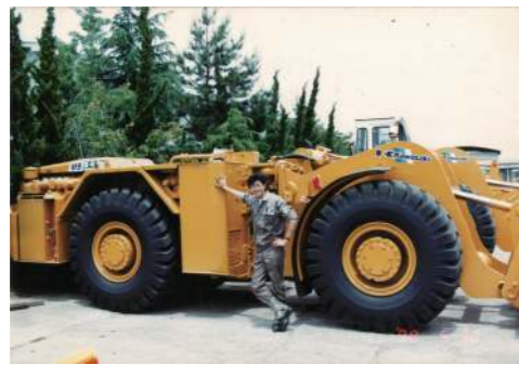
川崎重工業株式会社建設機械事業部勤務時代 (1990年)

私自身のことについていえば、成功したビジネスパーソンなどとは縁遠く、これまでの人生は、思いどおりにならないことの連続でありながら、いつの間にか、思い描いていたことよりもはるかに充実した日々を導かれています。母校・小樽商科大学では授業をさぼってTurbo Pascalでのプログラム