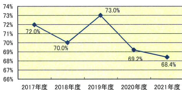
学生生徒等納付金比率