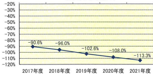
繰越収支差額比率