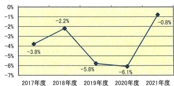
経常収支差額比率