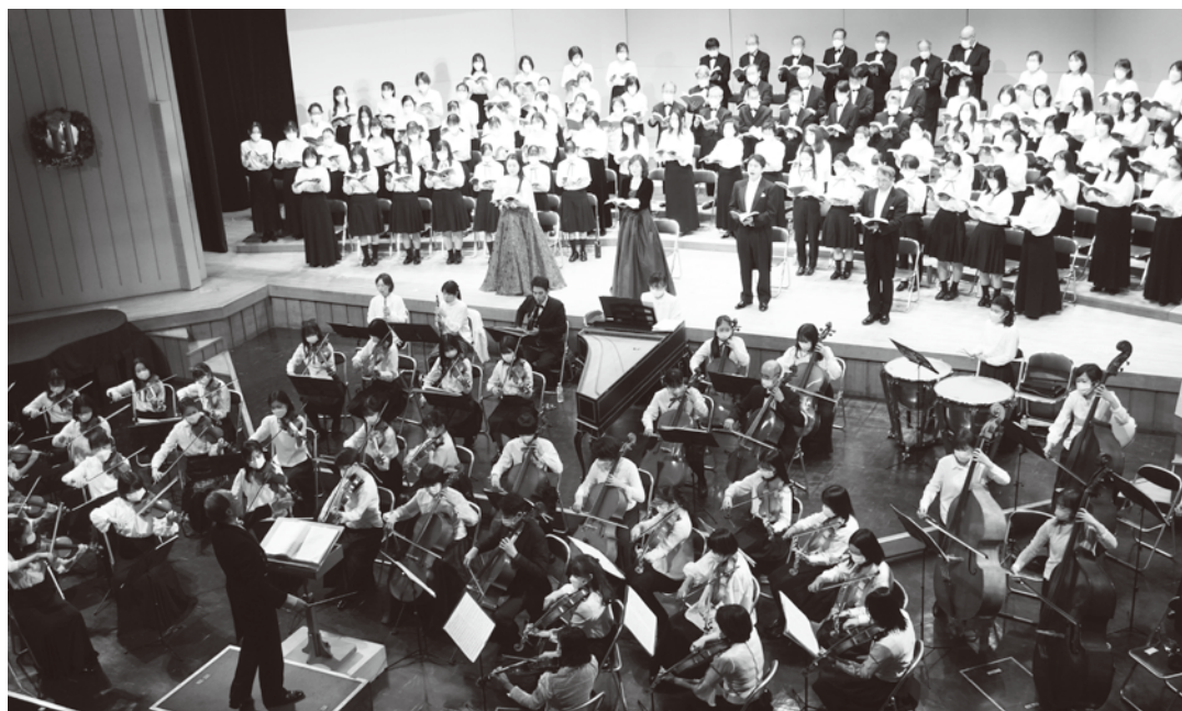
2022年12月 第36回 メサイア コンサート